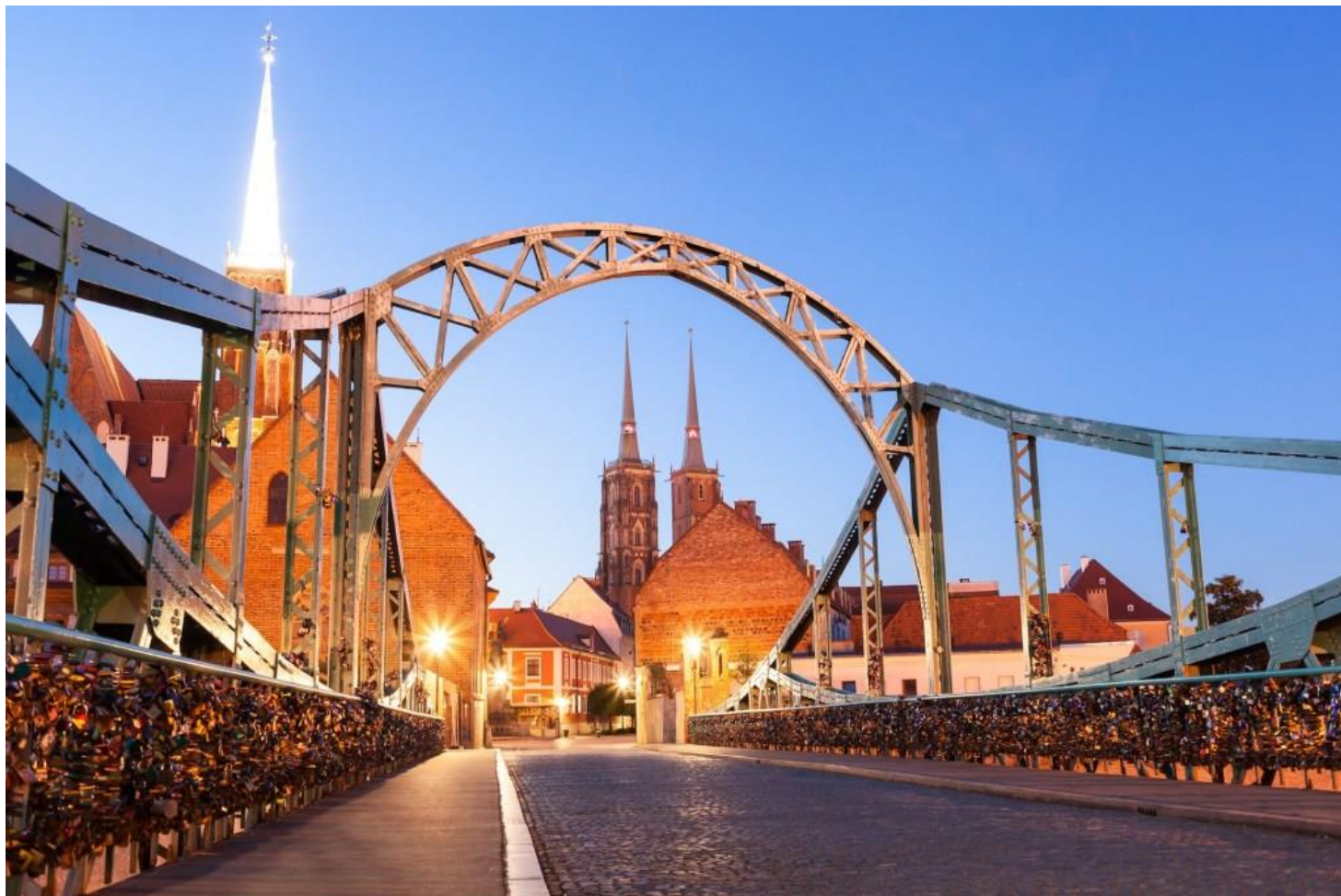
Dombrücke in Breslau

Anmeldungen nehmen bereits jetzt die Vorstandsmitglieder entgegen.